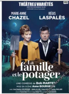
Affiche du spectacle "La Famille et le Potager" 2021