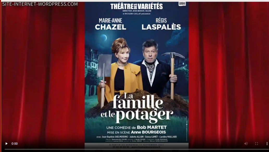
Teaser de la pièce de théâtre "La Famille et le Potager" mise en scène par Anne Bourgeois en 2021.